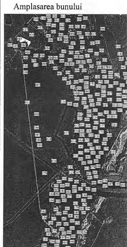
Semne convenționale 0617 - numărul cadastral al terenului