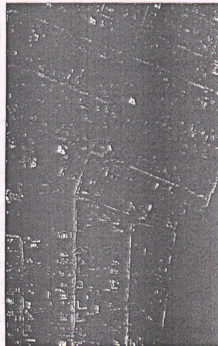
219 - numărul cadastral al terenului 01 - numărul cadastral al clădirii