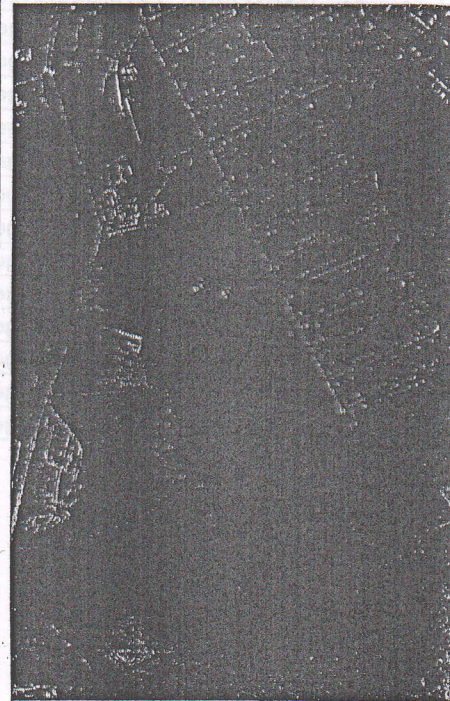
284 - numarul cadastral al terenului 01 - numarul cadastral al cladirii