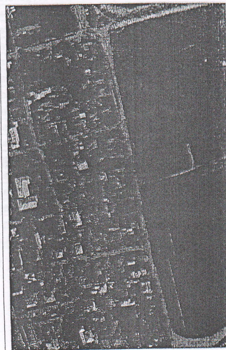
118 - numărul cadastral al terenului 01 - numărul cadastral al clădirii