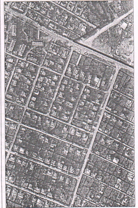
055 - numărul cadastral al terenului 01 - numărul cadastral al clădirii