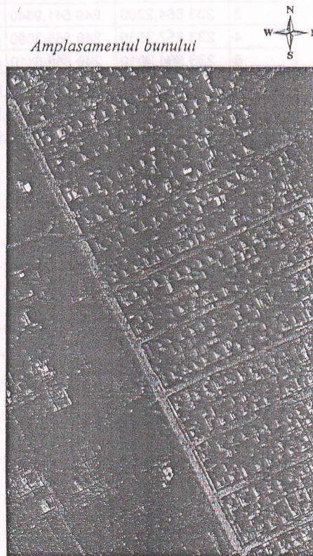
162 - numărul cadastral al terenului 01 - numărul cadastral al clădirii