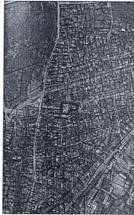
083 - numărul cadastral al terenului 01 - numărul cadastral al clădirii