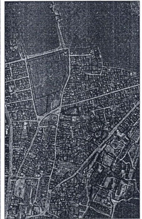
063 - numărul cadastral al terenului 01 - numărul cadastral al clădirii