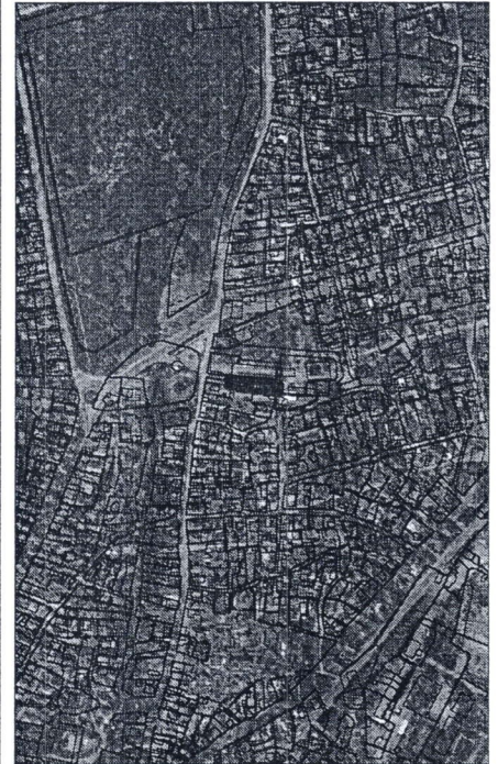
081 - numărul cadastral al terenului 01 - numărul cadastral al clădirii