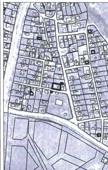
226 - numarul cadastral al terenului 01 - numarul cadastral al cladirii