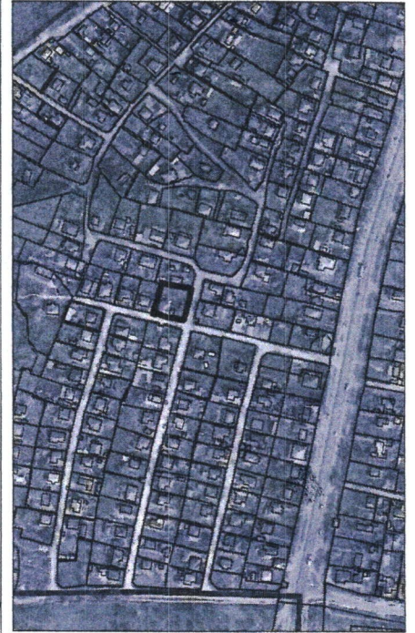
155 - numărul cadastral al terenului 01 - numărul cadastral al clădirii