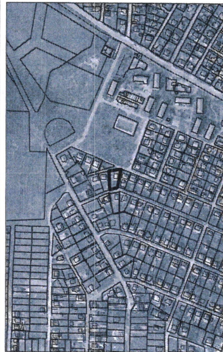
132 - numărul cadastral al terenului 01 - numărul cadastral al clădirii