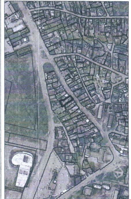
014 - numărul cadastral al terenului 01 - numărul cadastral al clădirii