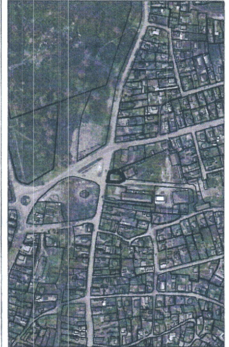
076 - numarul cadastral al terenului 01 - numarul cadastral al cladirii