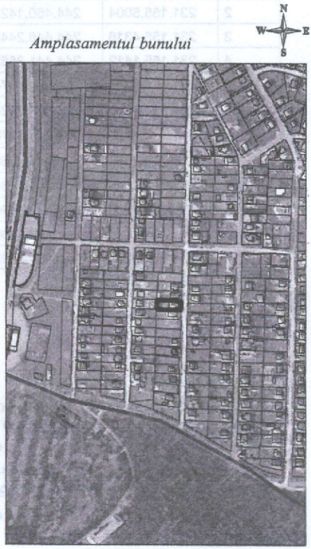
Amplasamentul bunului 420 - numarul cadastral al terenului 01 - numarul cadastral al cladirii