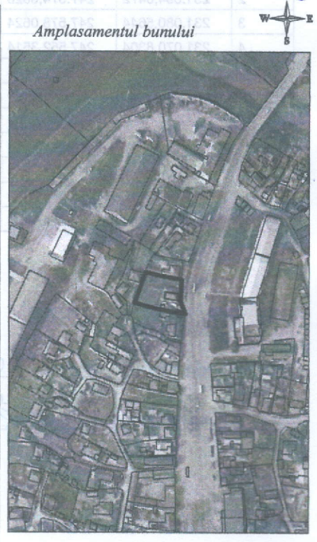
017 - numarul cadastral al terenului 01 - numarul cadastral al cladirii