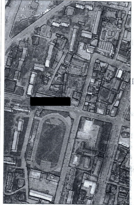
274 - numărul cadastral al terenului 01 - numărul cadastral al clădirii