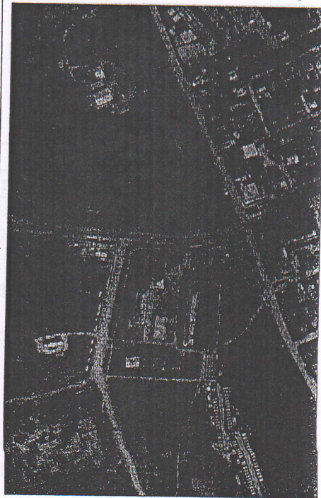
106 - numărul cadastral al terenului 01 - numărul cadastral al clădirii