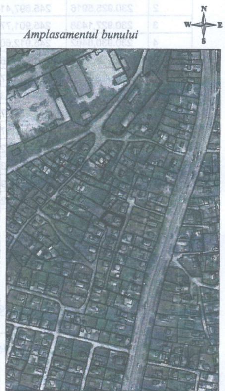
195 - numarul cadastral al terenului 01 - numarul cadastral al cladirii