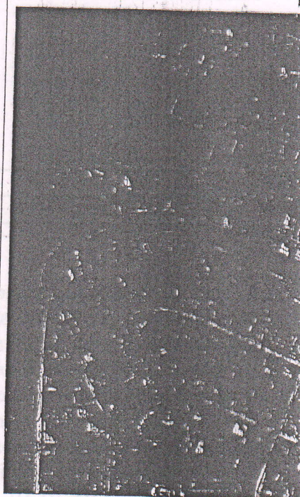
158 - numărul cadastral al terenului 01 - numărul cadastral al clădirii