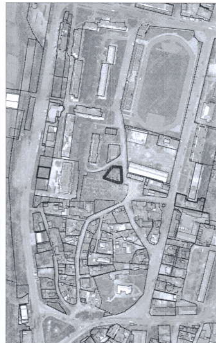
107 - numărul cadastral al terenului 01 - numărul cadastral al clădirii