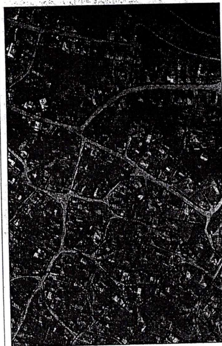
238 - numărul cadastral al terenului 01 - numărul cadastral al clădirii