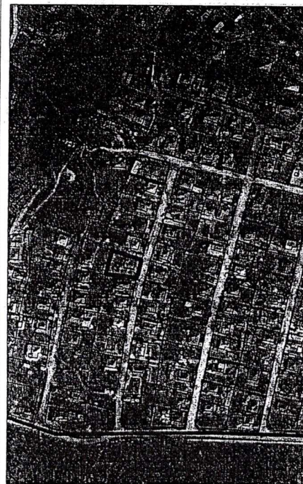
138 - numărul cadastral al terenului 01 - numărul cadastral al clădirii