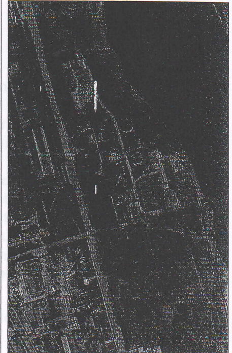
056 - numarul cadastral al terenului 01 - numarul cadastral al cladirii