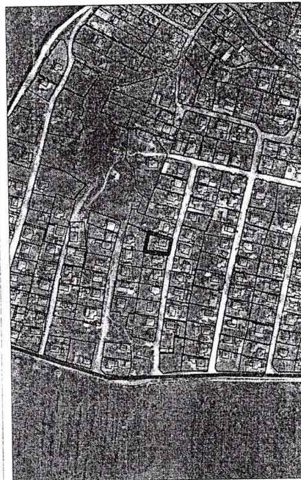
138 - numărul cadastral al terenului 01 - numărul cadastral al clădirii