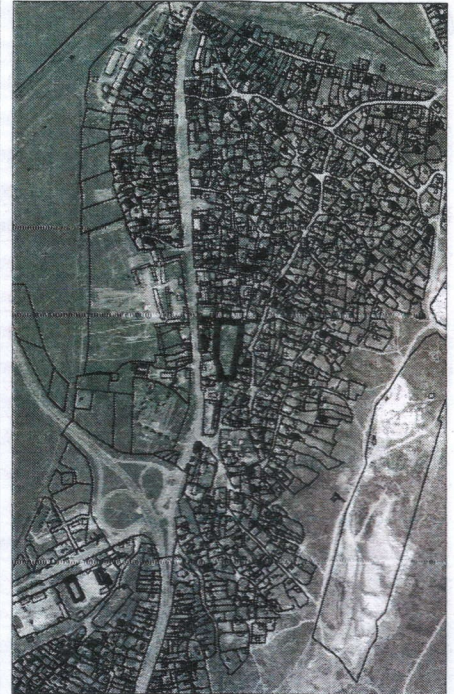
251 - numărul cadastral al terenului 01 - numărul cadastral al clădirii