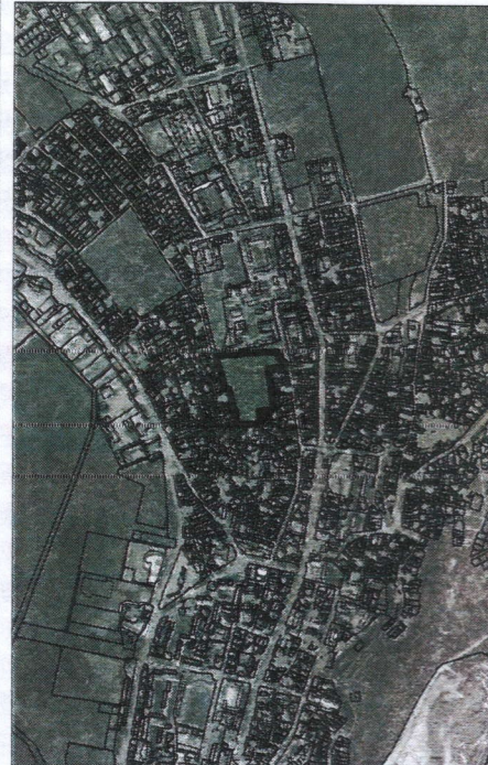
156 - numărul cadastral al terenului 01 - numărul cadastral al clădirii