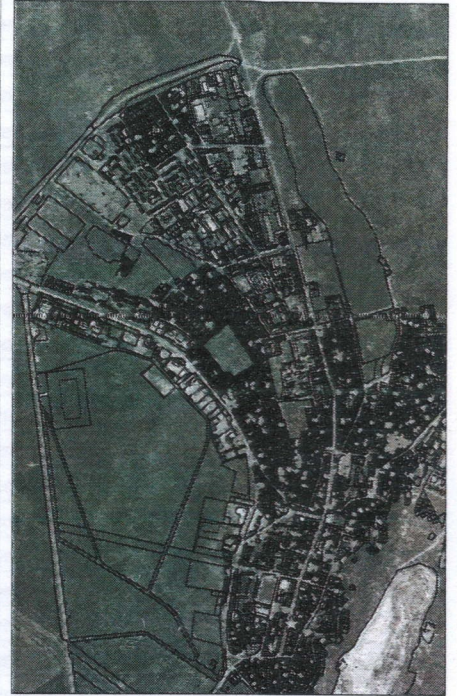
094 - numărul cadastral al terenului 01 - numărul cadastral al clădirii