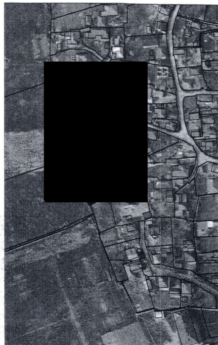
113 - numărul cadastral al terenului 01 - numărul cadastral al clădirii