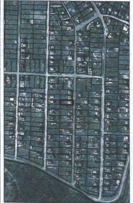
421 - numarul cadastral al terenului 01 - numarul cadastral al cladirii