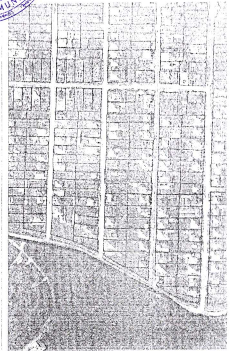
408 - numărul cadastral al terenului 01 - numărul cadastral al clădirii