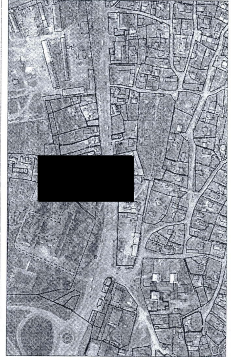
262 - numărul cadastral al terenului 01 - numărul cadastral al clădirii