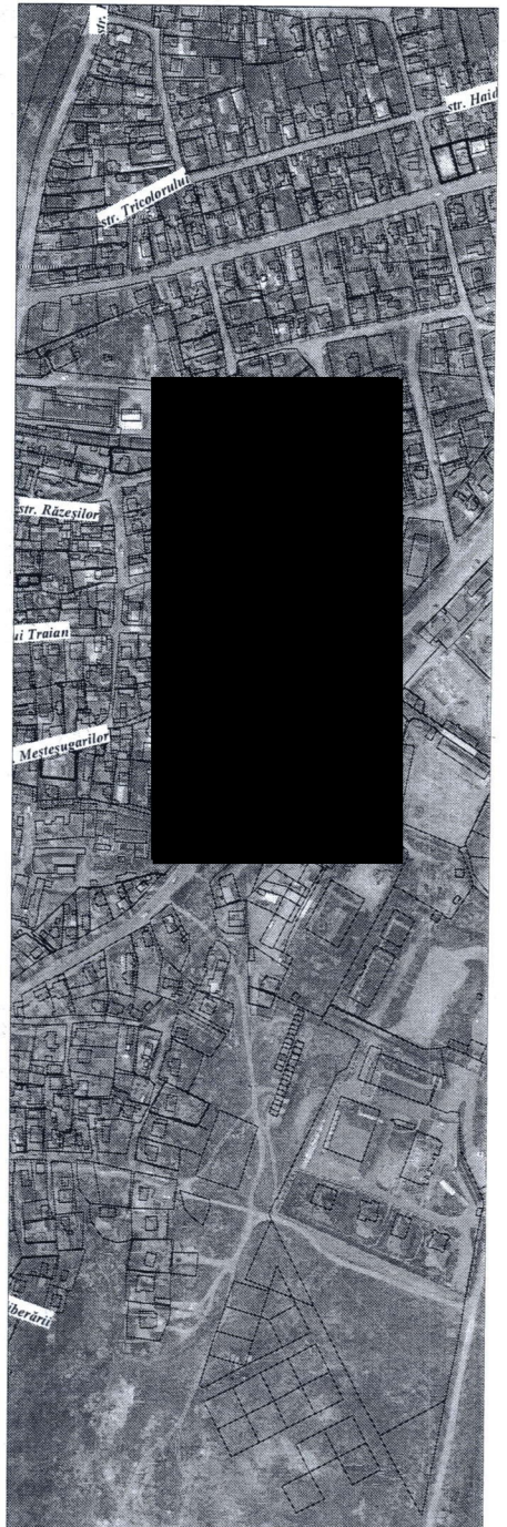
085 - numarul cadastral al terenului 01 - numarul cadastral al cladirii