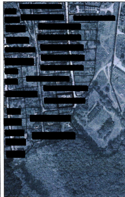
525 - numărul cadastral al terenului 01 - numărul cadastral al clădirii