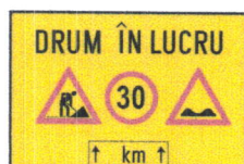
T 6.1 Drum în lucru