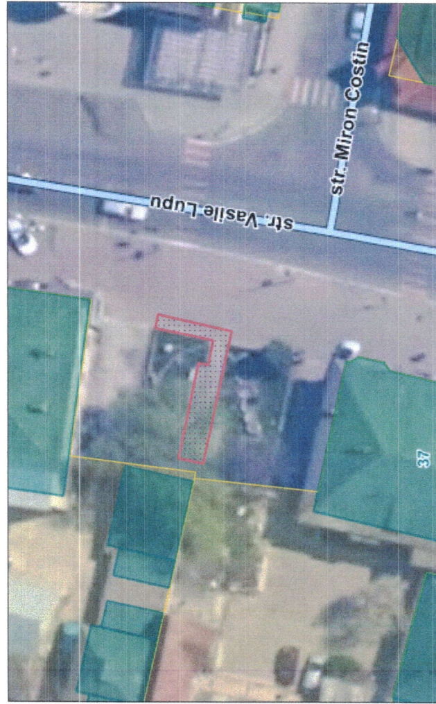
Plan detaliu sc. 1:500