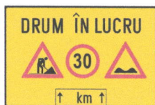
T 6.1 Drum în lucru