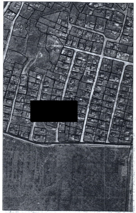
129 - numărul cadastral al terenului 01 - numărul cadastral al clădirii