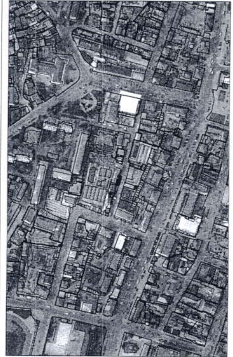
239 - numărul cadastral al terenului 01 - numărul cadastral al clădirii