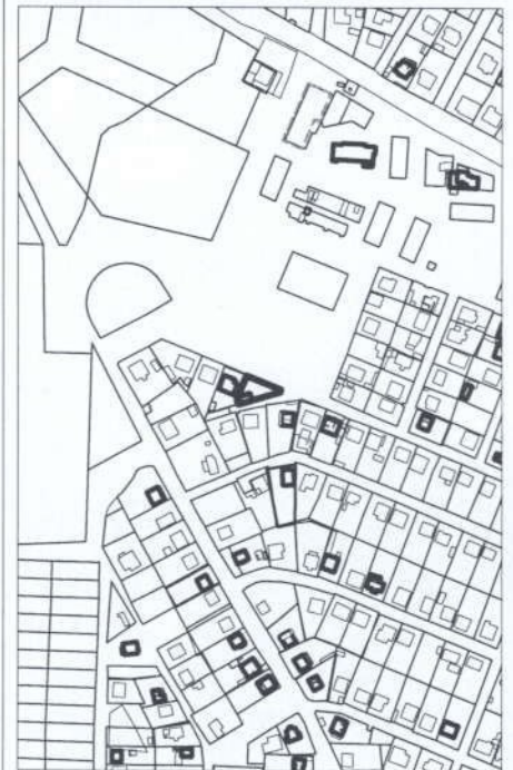
■ numărul cadastral al terenului 01 - numărul cadastral al clădirii