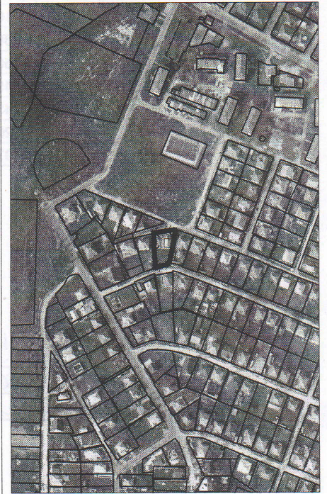
132 - numarul cadastral al terenului 01 - numarul cadastral al cladirii