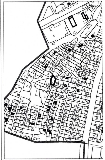
numărul cadastral al terenului 01 - numărul cadastral al clădirii