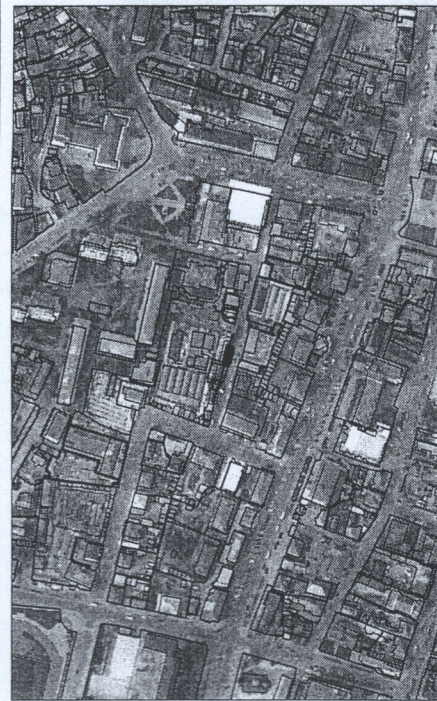
239 - numarul cadastral al terenului 01 - numarul cadastral al cladirii