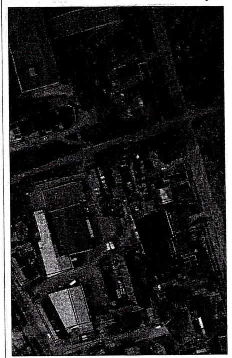
038 - numarul cadastral al terenului 01 - numarul cadastral al cladirii