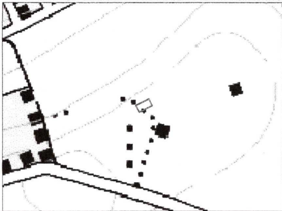
Schema de încadrare