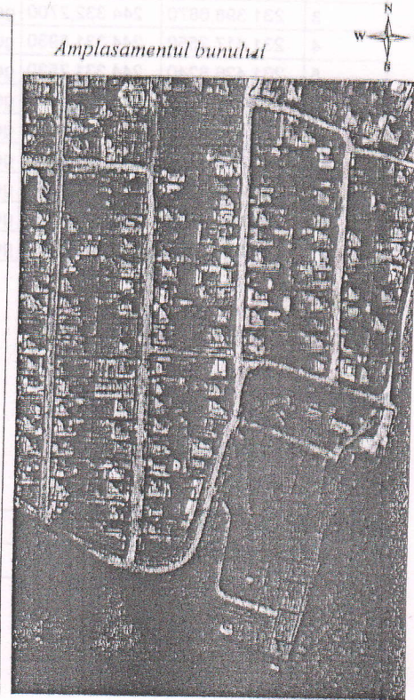
264 - numărul cadastral al terenului 01 - numărul cadastral al clădirii