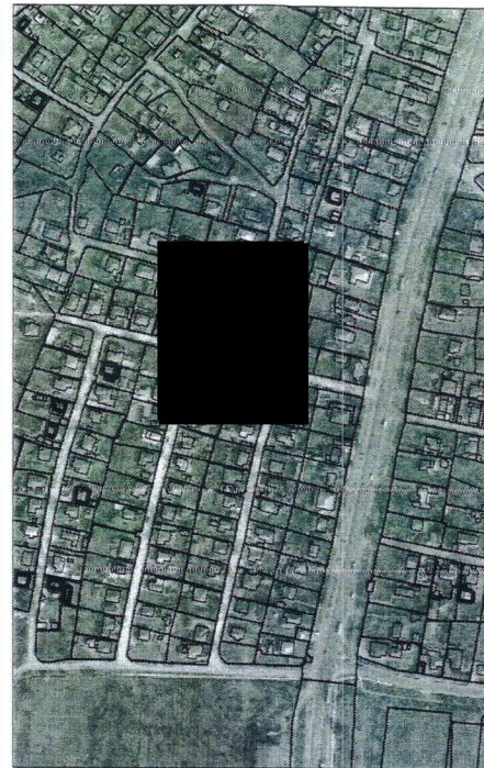
098 - numarul cadastral al terenului 01 - numarul cadastral al cladirii