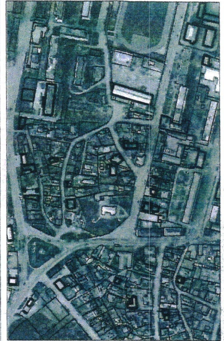
071 - numărul cadastral al terenului 01 - numărul cadastral al clădirii