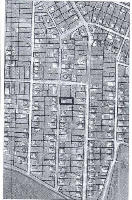
544 - numărul cadastral al terenului 01 - numărul cadastral al clădirii