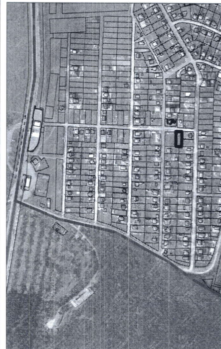
415 - numărul cadastral al terenului 01 - numărul cadastral al clădirii